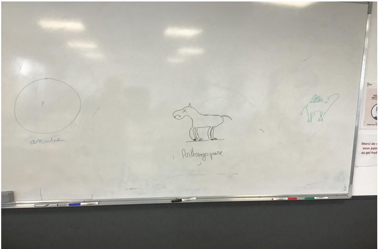
(A droite un veau coelosmien).